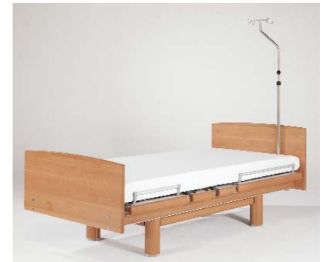
ISO-Normschiene ZK-1083/6 (40 cm)

IV pole / Tige porte-sérum / Infuusstandaard