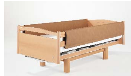
Seitengitterschutzbezug ZP-2056 E oder ZP-2056 EN, durchgehend, für Erhöhung Full-length protective pads for side rails with height extension / Housse de protection pour barrière latérale, d'un seul tenant, avec rehausse / Zijhek- beschermpjes doorlopend, verhoging