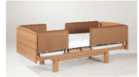
Seitengitterschutzhauben ZP-3056 CE / ZK-981 E, für Erhöhung Assist rail pads, 2 pieces with height extension / Housses de protection pour rehausse de sécurités médianes / Zijhek-beschermpjes als kap, verhoging (ohne Abb. / not illustrated / non illustré / zonder afbeelding)