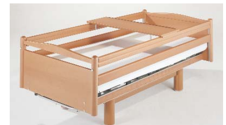
Schiebetablett ZP-2052 Sliding tray / Tablette coulissante / Eet-lesblad

→ Alle beschermhoezen zijn vervaardigd van een schuimlaag met een kunstlederen overtrek die bestand is tegen desinfecteermiddelen en worden als complete set voor een verpleegbed geleverd.