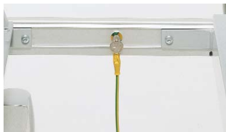
Potentialausgleichskabel ZP-948 (3 m) Voltage compensator cable / Câble d'équipotentialité / Potentiaalvereffe- ningskabel