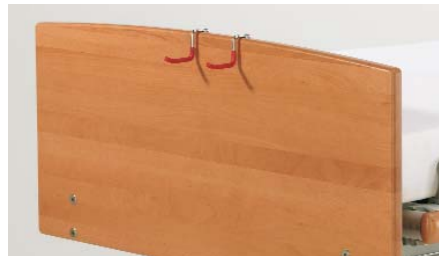
Fixiergurthalterung ZP-3051/3 (1 Paar)

Assist rail spacer holder / Support pour sécurité médiane / Ophanghaak beschermplaat