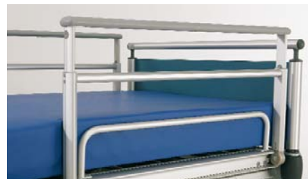
Seitengittererhöhung ZP-3074 / ZK-991 Side rail height extension / Rehausse de sécurité latérale / Zijhekverhoging